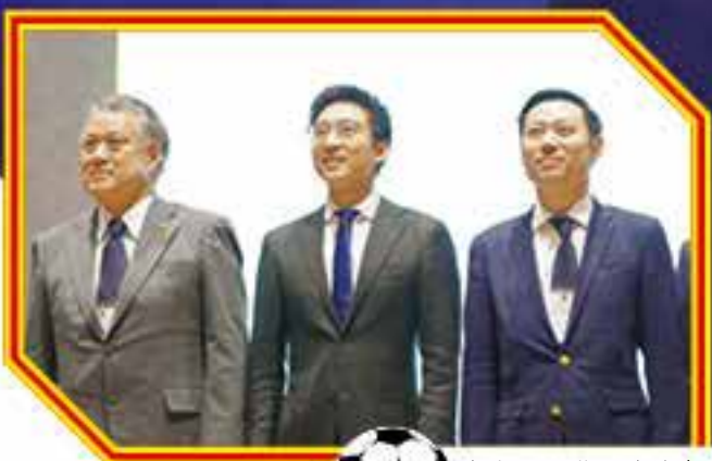
中國香港足球總會主席霍啟山（中）帶領的足球總新班子將為香港足球發展注入新動力。