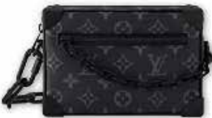
Louis Vuitton Mini Soft Trunk $36,500/f

Louis Vuitton 絕對是男生享用手袋最大推手，加上 Pharrell Williams 加盟成為男裝創意總監後，相信是一眾男生的福分。品牌其中一款極受歡迎的出品有 Mini Soft Trunk 手袋，採用 Monogram Eclipse 帆布製成，紡織襯裡搭配牛皮飾邊，造型稜角分明，新季推出暗黑色調配上黑色啞面樹脂鏈帶及金屬件，絕對是型格之選。