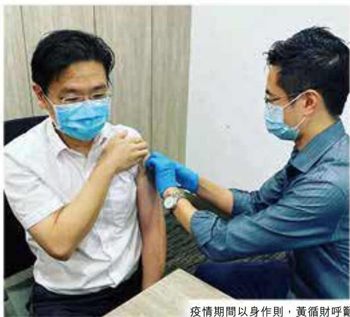
疫情期間以身作則，黃循財呼籲民眾接種疫苗。