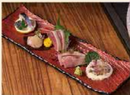
天草牛深特選刺身盛五點 $428