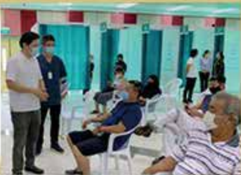
黃循財盡心盡力助新加坡抗疫。