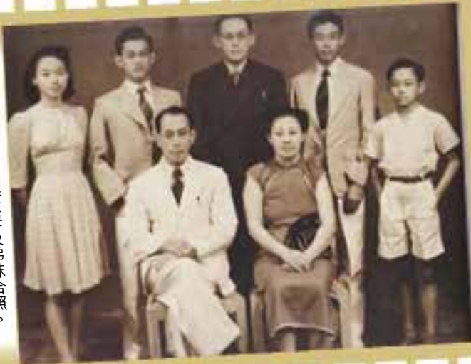
李光耀（後排中）與父母及弟妹合照。