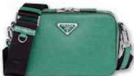
Prada Brique Saffiano $ 21,800/d

想輕鬆出門，輕巧的Prada Brique Saffiano是一眾時尚達人至愛。方正的手袋線條流麗，搭配上以刮紋效果及蠟面潤飾Prada Saffiano皮革，加上與皮革同色系的搪瓷Prada金屬三角形標誌，絕對Match大熱輕奢風。