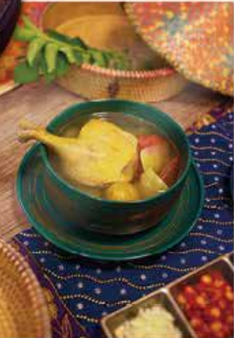
梅子鹹菜燉鴨腿湯 $76