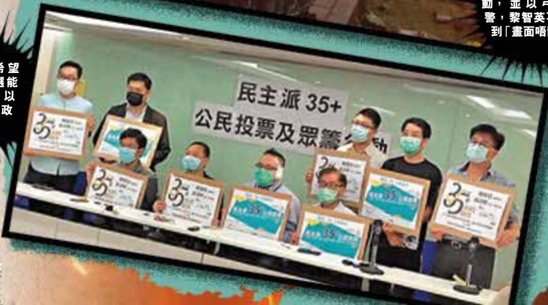
黎智英希望民主派初選能成為傳統，以選票制衡政府。