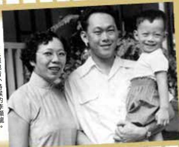
年輕的李光耀抱着小時候的李顯龍。