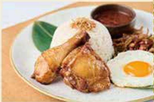
地道椰漿飯 $198 椰汁煲煮過的米飯香噴噴，與外脆內嫩的炸雞同吃，美味又香口。