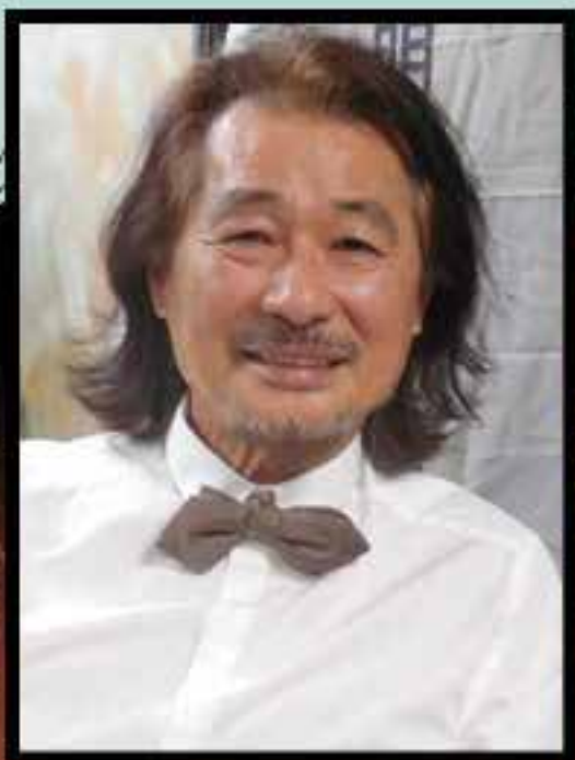
施明德(圖)曾提醒劉祖迪要有犧牲精神。

黎智英又就李宇軒的美國之行發表意見，認為該次他們去接觸的議員均是老泛民早有的聯繫，實在不必再花心神，反而應該去結識低級官員，10