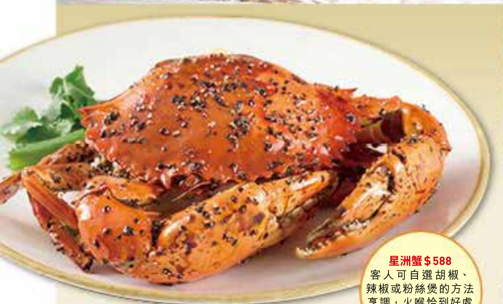
星洲蟹 $588 客人可自選胡椒、辣椒或粉絲煲的方法烹調，火候恰到好處保留蟹肉的鮮美。