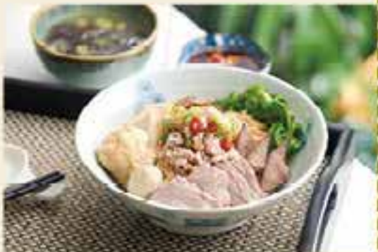
肉脞麵 $188 肉脞即是肉碎，加上豬肝、豬肉片、肉丸及魚片等配料，豐富飽肚又滋味。