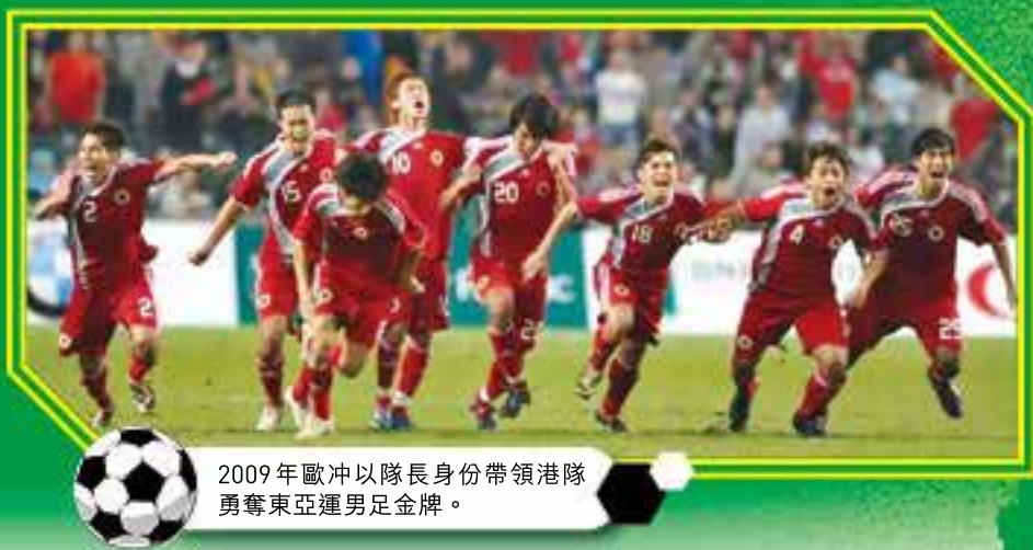
2009年歐冲以隊長身份帶領港隊勇奪東亞運男足金牌。

去年底（2023年），香港男足在杭州亞運歷史性殺入四強。踏入2024，香港隊在亞洲盃決賽周，力拚伊朗不落下風。之後，停辦4年的賀歲盃復辦，世界知名球星亦接連訪港踢表演賽。球隊有好成績，加上球星訪港振興了球市，香港足球似乎迎來復興之勢。