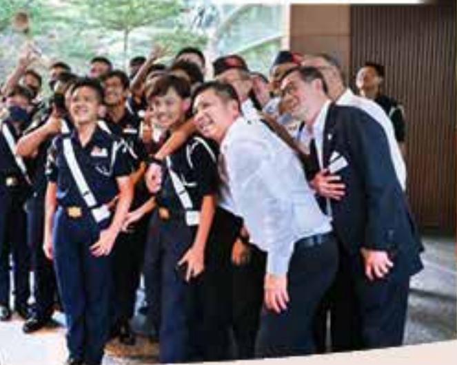
黃循財「草根精英」的親民形象深入人心。