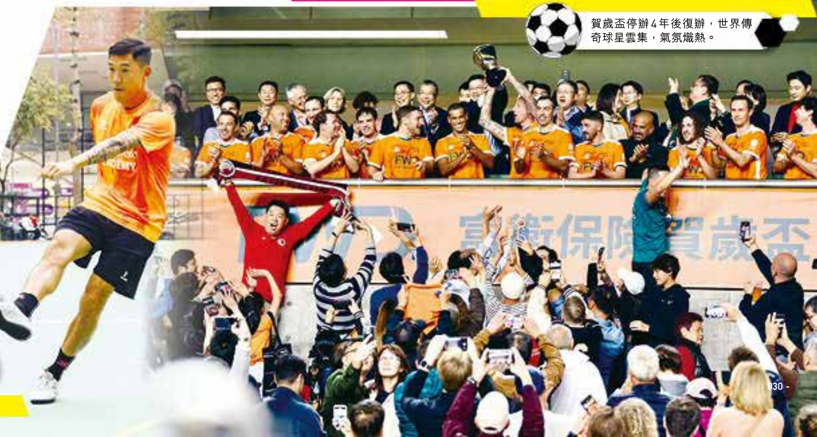
賀歲盃停辦4年後復辦，世界傳奇球星雲集，氣氛熾熱。