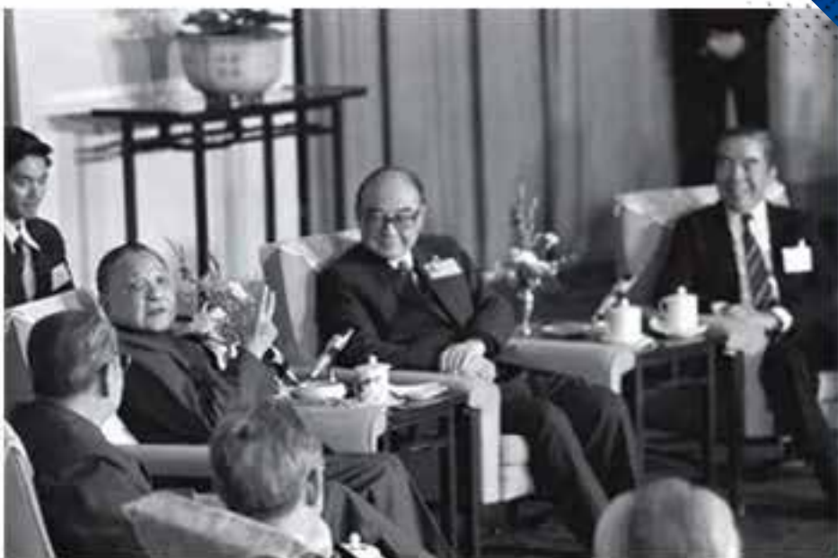
1987年鄧小平會見香港基本法起草委員會成員時，提及香港回歸後可以繼續批評共產黨。