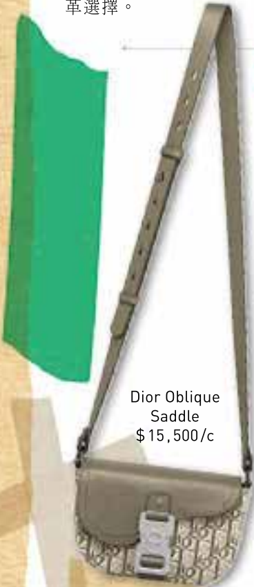
Dior Oblique Saddle $ 15,500/c

極具優雅現代感設計的馬鞍郵差包Dior Saddle以卡其色 Dior Oblique提花面料製成，配上同色系粒面小牛皮馬鞍翻蓋及Christian Dior標誌性鋁製搭扣，魅力十足，配上皮革肩帶可以手提、肩揹或斜揹。