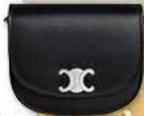
Celine Besace Triomphe $ 29,500/a Celine Besace Triomphe是BTS防彈少年團成員V金泰亨的常用手袋。黑色，$ 14,500/a

倘若你是極簡風愛好者，那麼Celine自是你杯茶。由Hedi Slimane 2018年創作的Triomphe系列，更是品牌標誌之一，當中有柔美造型的Besace Triomphe，圓渾曲線輪廓成為一眾時尚達人至愛，就連BTS防彈少年團成員V金泰亨都經常戴用，成為中性手袋極火型號。品牌新作還有標誌印花牛皮皮革Roller Bag，同樣貫徹簡約造型。