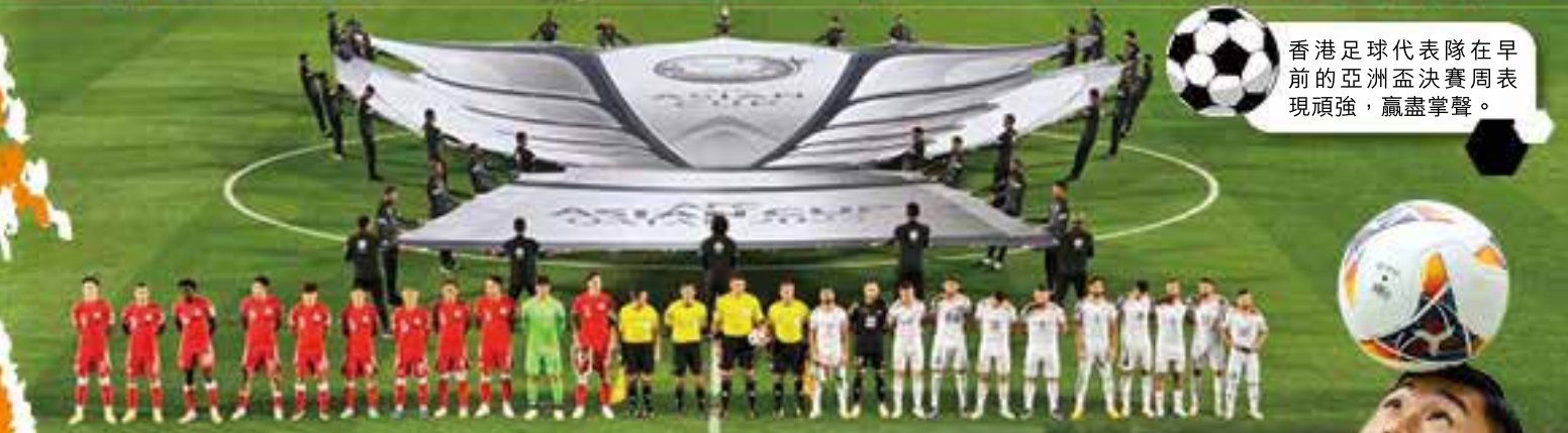
香港足球代表隊在早前的亞洲盃決賽周表現頑強，贏盡掌聲。