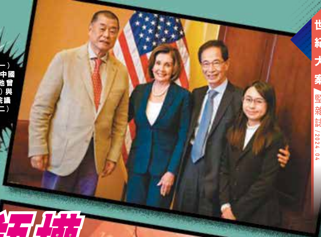
黎智英（左一）爭取美國制裁中國和香港政府，他曾與李柱銘（左三）與時任美國眾議院議長佩洛西（左二）會面商議。