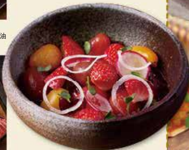
熊本彩虹番茄士多啤梨沙律 $148