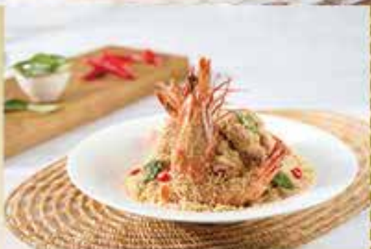
麥皮牛油蝦 $588 蝦殼外層是牛油炒香的麥皮，入口酥鬆脆口有牛油香，香口有嚼勁，蝦肉仍爽甜。