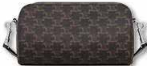
Celine Roller Bag $ 14,500/a