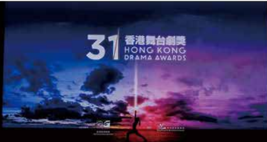
第31屆香港舞台劇獎頒獎禮，去年6月14日在葵青劇院演藝廳舉行。