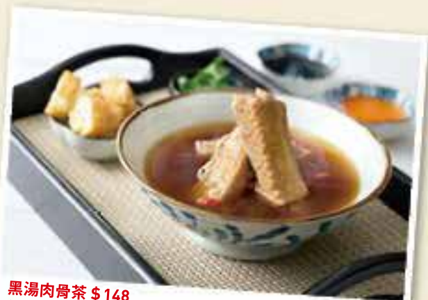
黑湯肉骨茶 $148 新鮮豬肋骨混合多種藥材及配料熬成黑湯，其貌不揚但香氣撲鼻又暖胃。