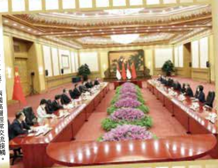
中新關係一直良好，兩國高層經常交流接觸。

除了李鴻毅，李顯龍胞弟李顯揚的兒子李繩武亦是李家第三代中的佼佼者。李繩武身為李家優秀子嗣，卻也無心政治，全副心神投入學術研究之中。他曾在公開場合中表示：「新加坡不再需要一個李家領導人。」隨着李家第三代遠離政治，「李氏王朝」在李顯龍之後或將劃上時代的句號。