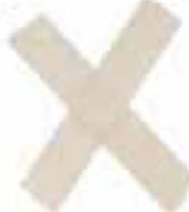
FENDI Peekaboo ISeeU XCross $ 28,500/b

FENDI男神大使李敏鎬用的是Peekaboo ISeeU XCross斜揹袋。