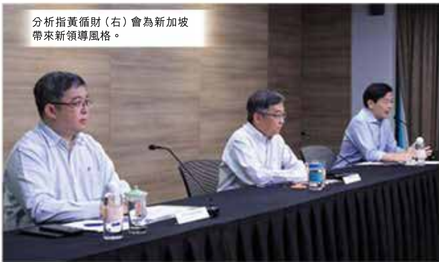
分析指黃循財(右)會為新加坡帶來新領導風格。