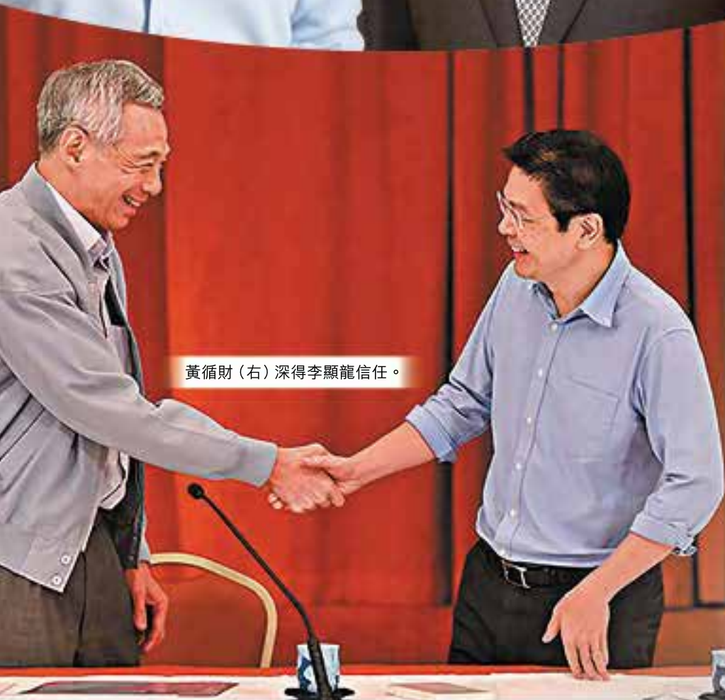
黃循財（右）深得李顯龍信任。