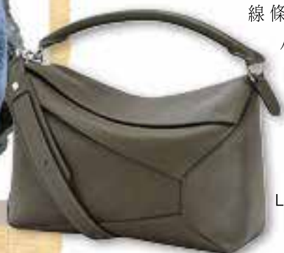
Loewe Puzzle Bag/g

Gucci Ophidia GG Crossbody Bag $12,100/h