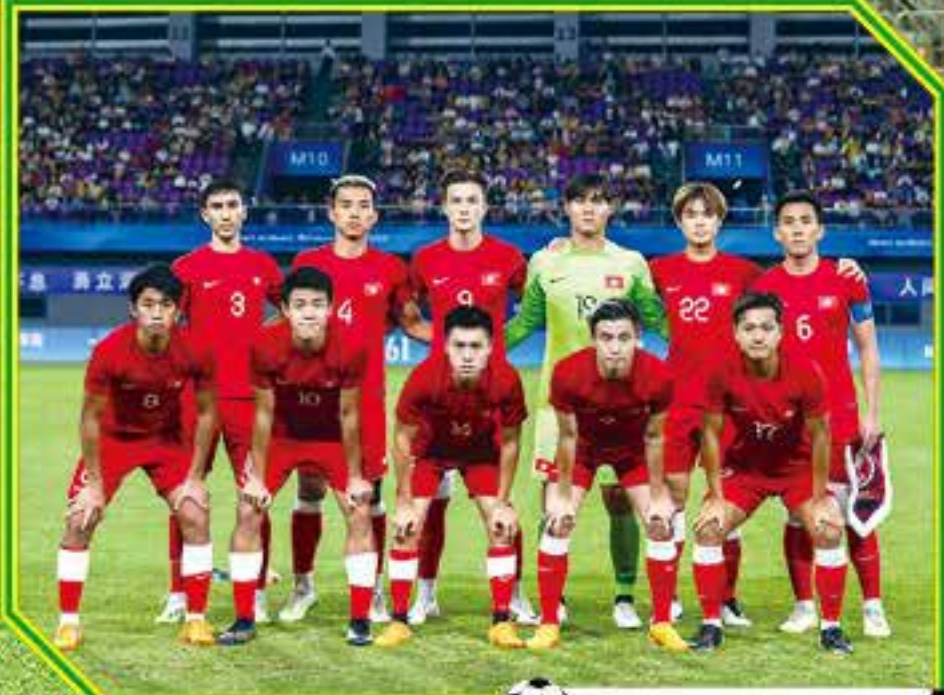
杭州亞運會港隊歷史性殺入四強。