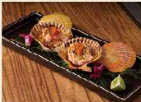
汁燒明太子天草緋扇貝 $128

以白柚「和王」和牛串為例，「和王」是指熊本最高等級的和牛品種，具「和牛之霸」美譽。主廚貪其肉質細膩柔軟，油脂分布均勻，伴晚白柚燒香，有平衡的果香與肉味。