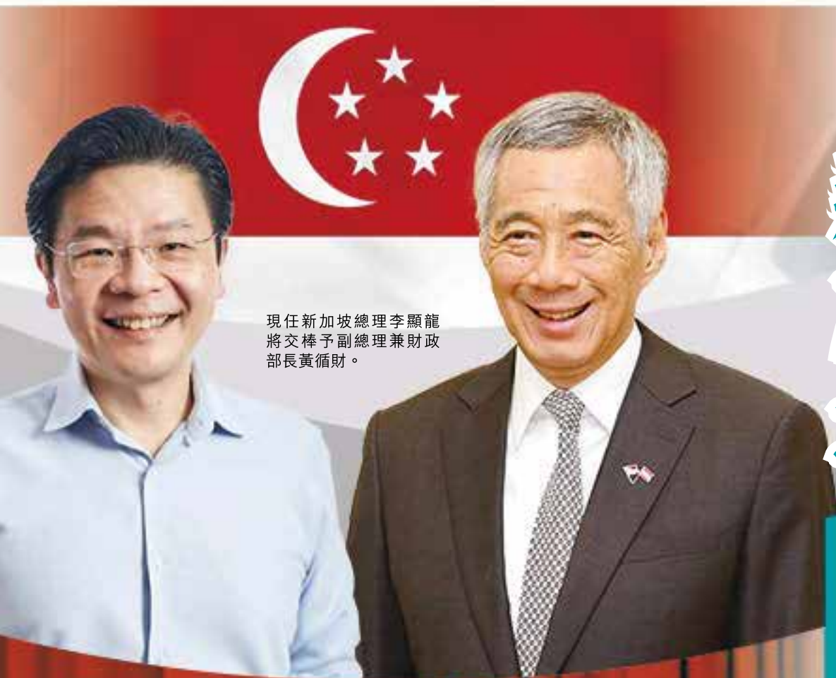
現任新加坡總理李顯龍將交棒予副總理兼財政部長黃循財。