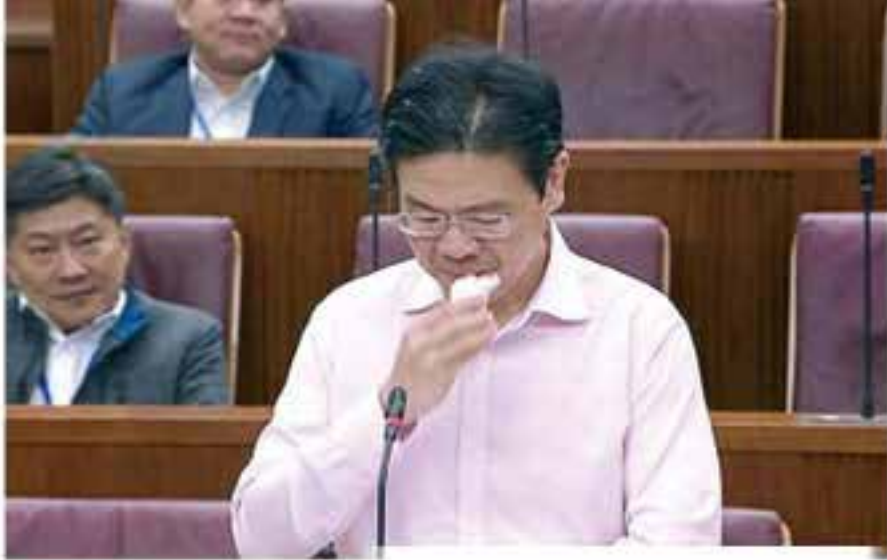
感謝前線抗疫人員時，黃循財落淚哽咽。