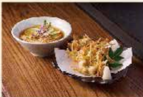
大蝦野菜天婦羅伴肥後手延冷素麵 $168