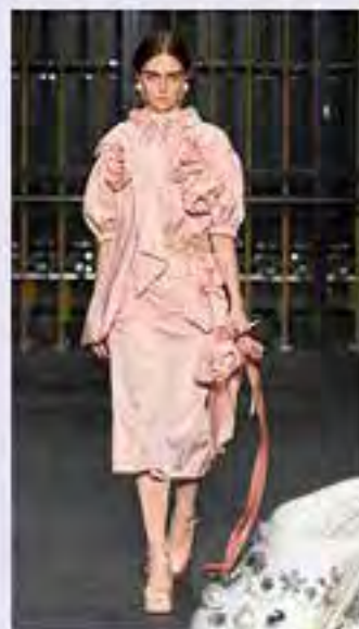
Simone Rocha 今季同樣大玩玫瑰主調，而且更與 Crocs 聯乘，將 Bling Bling 花卉潤飾鞋身。

玫瑰在情感世界有着不同意義，這亦被一眾時尚品牌無限延伸：Dolce & Gabbana 今季就將大大的黃玫瑰印花呈現在不同剪裁的連身裙之上，令新作洋溢着暖和愉快的感覺；另一邊廂 Moschino 在時裝展上以精緻浪漫的粉紅色玫瑰花裙示人，新推的玫瑰碎花單品一樣綺麗優雅。至於要數今季擁抱玫瑰之最的品牌，BALMAIN 絕對是代表。創意總監 Olivier Rousteing 以玫瑰印花、立體玫瑰呈現在高級訂製系列之中，表現女性魅力及自由態度，同時以花瓣、葉子、藤架以及花刺各部分化成創作元素，製作出皮包、高跟鞋等不同作品。