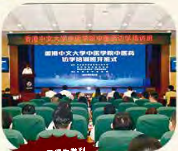
本地中醫學生常到內地訪學交流。

「政府及大學教育資助委員會」審批的名額，以2022年為例，當年向中大提出25個名額，但從2022年後，每年的名額持續縮減。由於政府每年批出的撥款數目與學生名額多寡有直接影響，若名額少將直接影響政府投放多少資源，屬於一個循環式關係。