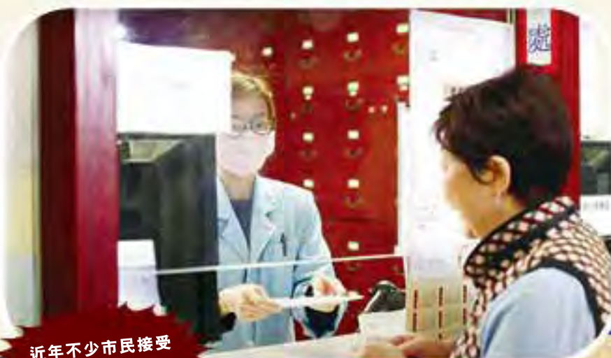
近年不少市民接受中醫治療。