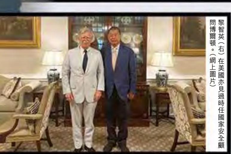
黎智英（右）在美國亦見過時任國家安全顧問博爾頓。