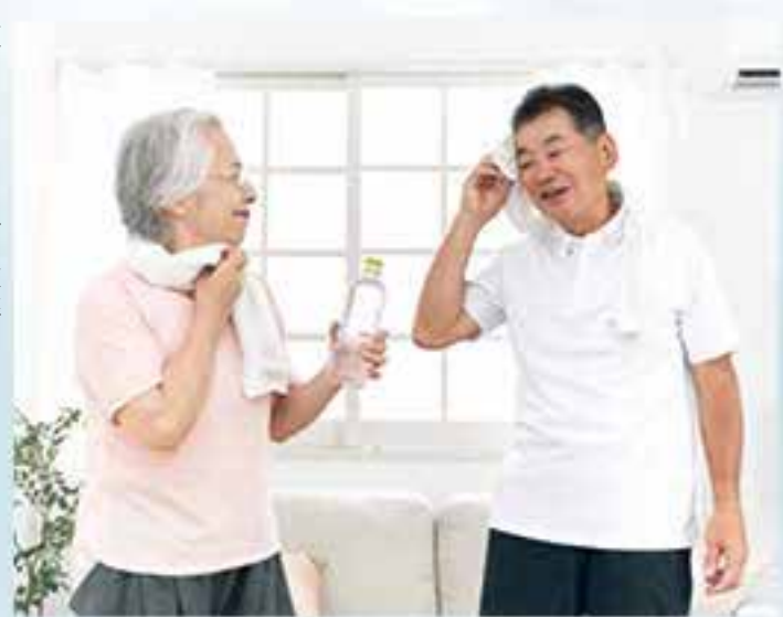
夏天出了一身大汗，應盡快以清水和毛巾潔淨，然後塗擦保濕品或防曬產品。

室內長期開冷氣，視乎需要可選擇開加濕和空氣清新二合一機，保持室內空氣潔淨和濕度，有利減低濕疹復發。