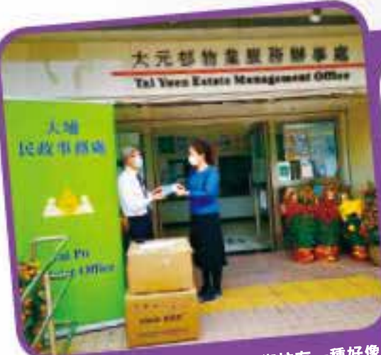
公共屋邨辦事處職員與街坊有一種好像老朋友般的關係。

每個月，不少長者戶都堅持要親身到辦事處交租，趁交租的期間與職員聊聊天，閒話家常，大家不止是老朋友，他們甚至會視一些年輕同事如子姪一樣。