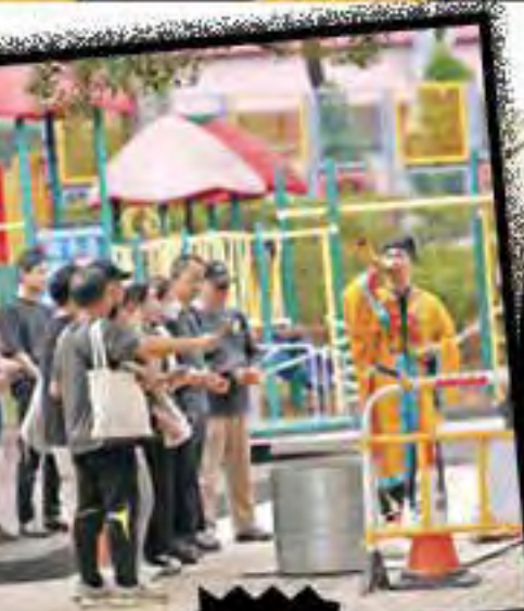
死者家屬在肇事沙井附近拜祭。