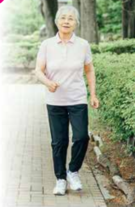
夏日戶外活動不宜過久，避免中午外出及做足防曬，減低皮膚受陽光中的紫外光傷害。

因此，長者比一般人更應該注重防曬，不論任何季節和天氣，因為紫外線可以穿過雲層，即使陰天也要注意防