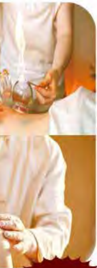
針灸及拔罐為中醫治療方法之一。

治療癌症藥物相當昂貴，病者也要承受難以形容的痛苦，陳永光認為從最早、最初步階段做功夫，才是較為理想的做法，也能減輕政府的醫療負擔，因此他看不到有甚麼理由拒絕增加對中醫學位撥款。其實只要爭取到撥給中醫的「相對成本加權數值」，從目前1.4逐步調整到3.0/3.6，與西醫看齊就可以：「資源充裕，就可以聘請一些更資深的導師講課。」