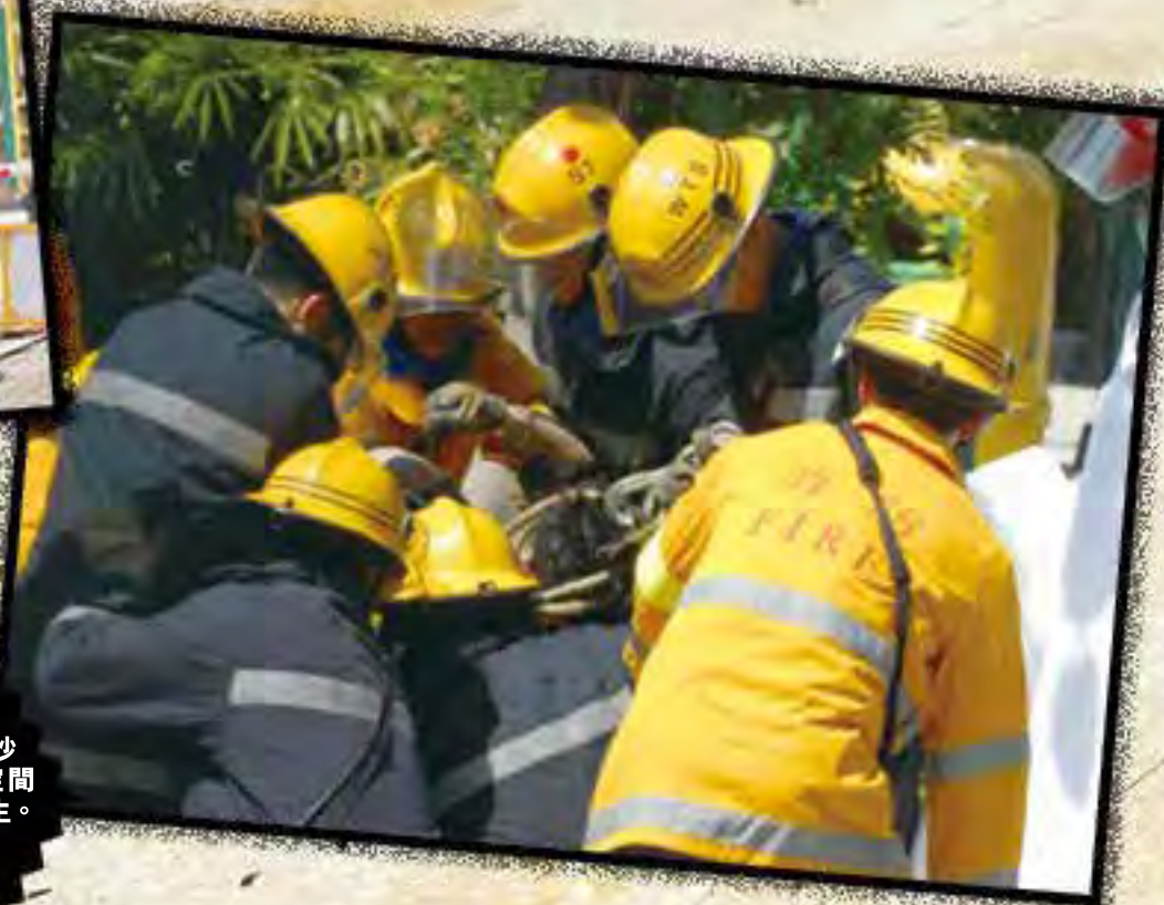
近年涉及沙井等密閉空間作業事故頻生。