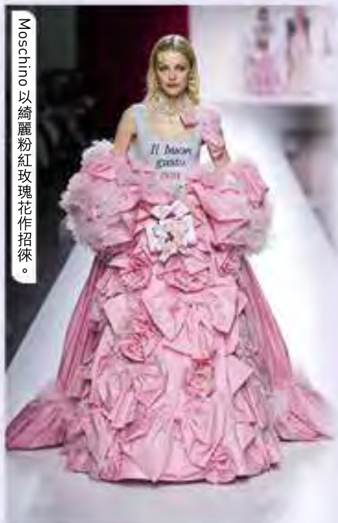
Moschino 以綺麗粉紅玫瑰花作招徠。

每逢春夏，充滿活力的 Floral Print 總會活躍於時尚舞台，今季當然不例外。