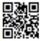
精彩影片 請掃QR code

對於內地餐飲品牌大舉攻港，周文港表示對本港不會有壞影響，反指現今商場「一式一樣」，這樣影響反而會更大。