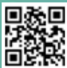
精彩影片 請掃QR code