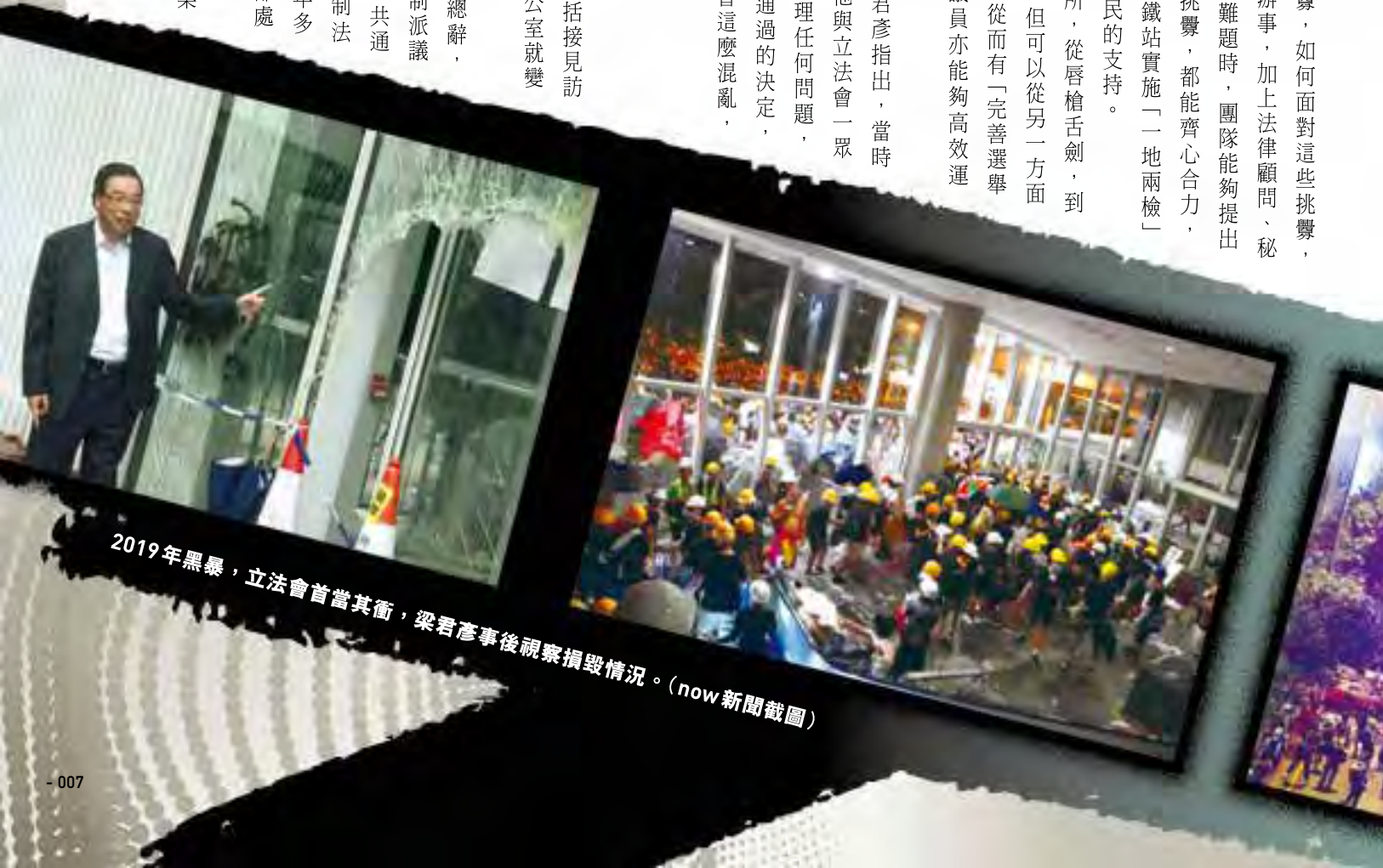
2019年黑暴，立法會首當其衝，梁君彥事後視察損毀情況。

梁君彥說，議會的高效、高質的審議方式，市民大眾也樂見。因為大家都看到，議會不單止為反對而反對，而是真正為市民做事，做實事，就算只得42位議員，同時亦要面對各種「復修