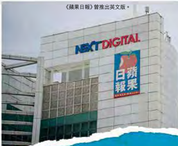
《蘋果日報》曾推出英文版。