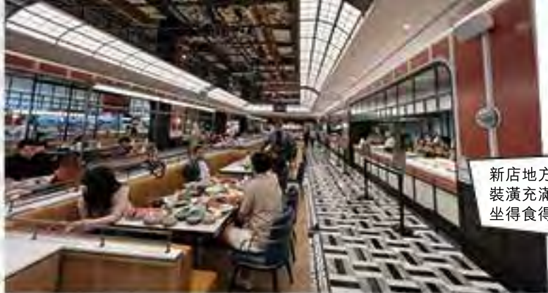
新店地方更寬敞， 裝潢充滿現代感， 坐得食得更舒適。