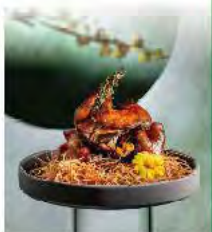
雲南鮮牛肝菌·茅香雛鴿 加有牛肝菌和香茅等熬成的滷水將雛鴿浸熟，然後風乾再用高溫油炸脆，香氣撲鼻。