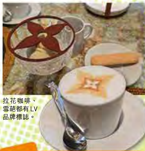
拉花咖啡、雪葩都有LV品牌標誌。

至於2樓部分則有印度名廚 Gaggan Anand 和 LV 合作開設的高級餐廳 Gaggan at Louis Vuitton，提供時令8道菜午餐及17道菜晚餐，價錢約為 THB 4,000（約港幣 $874）及 THB 8,000（約港幣 1,748）。