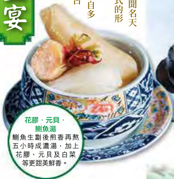
花膠·元貝· 鯽魚湯 鯽魚生剖後煎香再熬五小時成濃湯，加上花膠、元貝及白菜等更甜美鮮香。