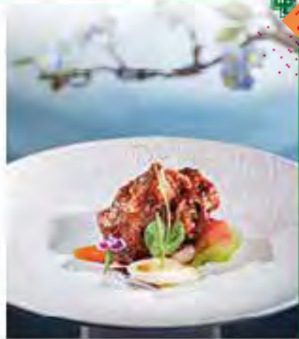
極黑和牛尾·金不換 薑蔥、金不換、西芹、甘筍、番茄與牛尾煲煮焗製至入味，令牛尾肉質細嫩香軟。