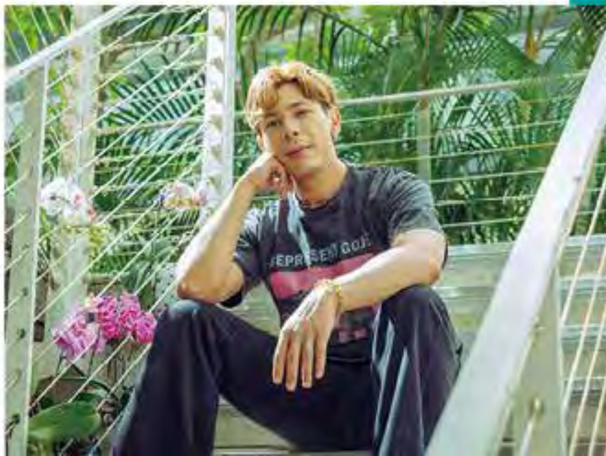
曾經驕傲輕狂，古淖文年輕時深信，終有一天會成爲樂壇巨星。