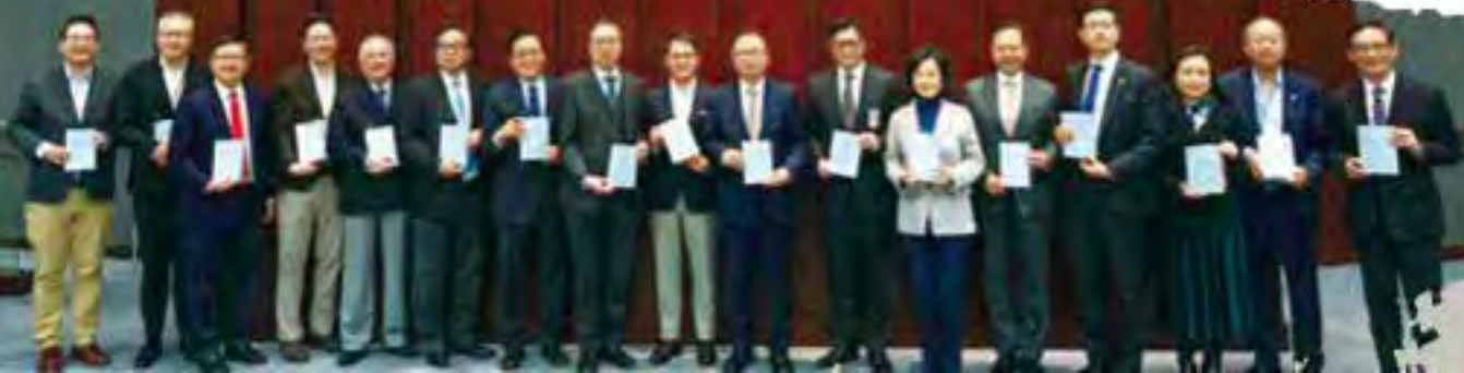
法案委員會委員與官員們完成審議工作後合照。

梁君彥作為立法會主席，在條例通過後破例投了贊成票，使《維護國家安全條例》在立法會全票共89票支持下通過，劃上完美句號。梁君彥會後說，今次他破例投下贊成票，因23條非普通本地立法，關乎特區和國家安全福祉，認為是特別情況，應有特別考慮，希望留下完美記錄。 在整個立法過程中，立法會主席，必定成為眾矢之的，成為反對者攻擊目標，梁君彥就指出，擔起主席一職，已經預到有這一步，「就算有沒有23條，對手都常常藉機攻擊我！」所以不會考慮得太多，只要堅守《基本法》及議事規則辦事，本着服務市民之心，正所謂「食得鹹魚就抵得渴」，只要做得正確的話，那怕遭到攻擊。