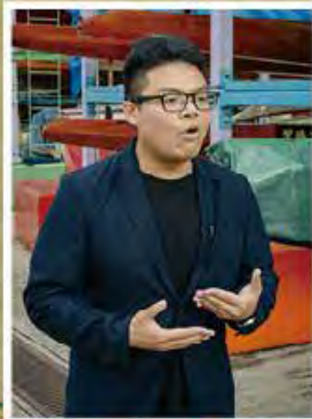
崔景恒指，各區應有組織統籌龍舟停泊事宜。