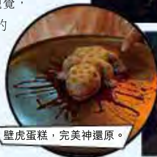
壁虎蛋糕，完美神還原。

VETMOM Cafe 地址：1096 1 Phahonyothin Rd, Chom Phon