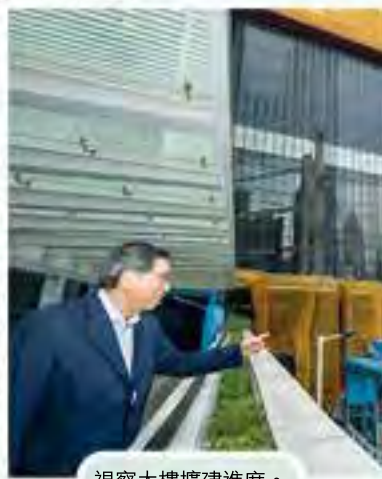
視察大樓擴建進度。