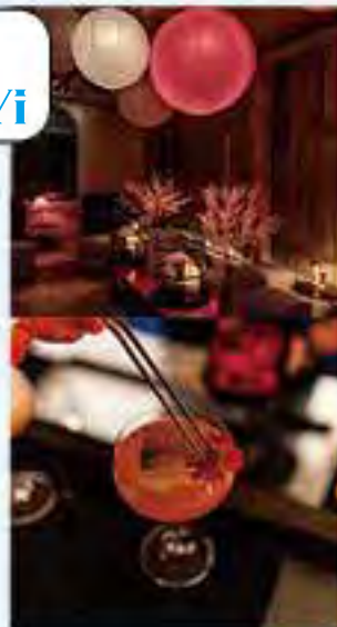
精緻的中國風裝置加上美酒，讓你在享受其中。

酒吧樓高兩層，二樓樓上雅座，有大紅燈籠高高掛作裝潢，相當有中國風。就連Menu都寫在中式紙扇上，Gimmick十足，與三五知己在這裏度過一個開心晚上最好不過。📍