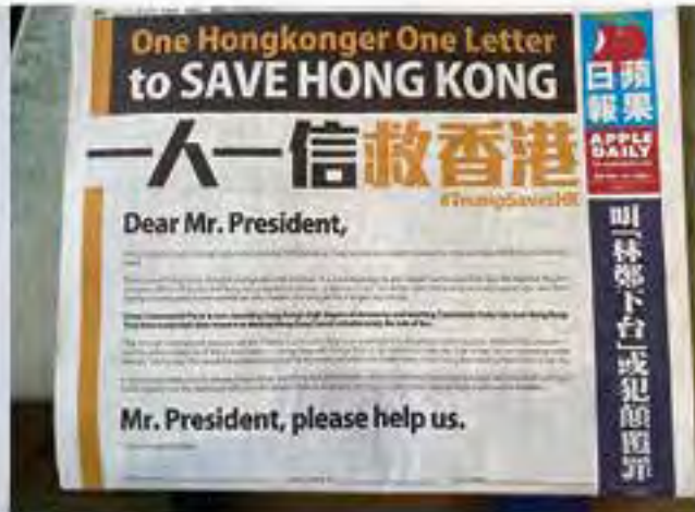
《蘋果日報》曾在頭版發起「一人一信救香港」。