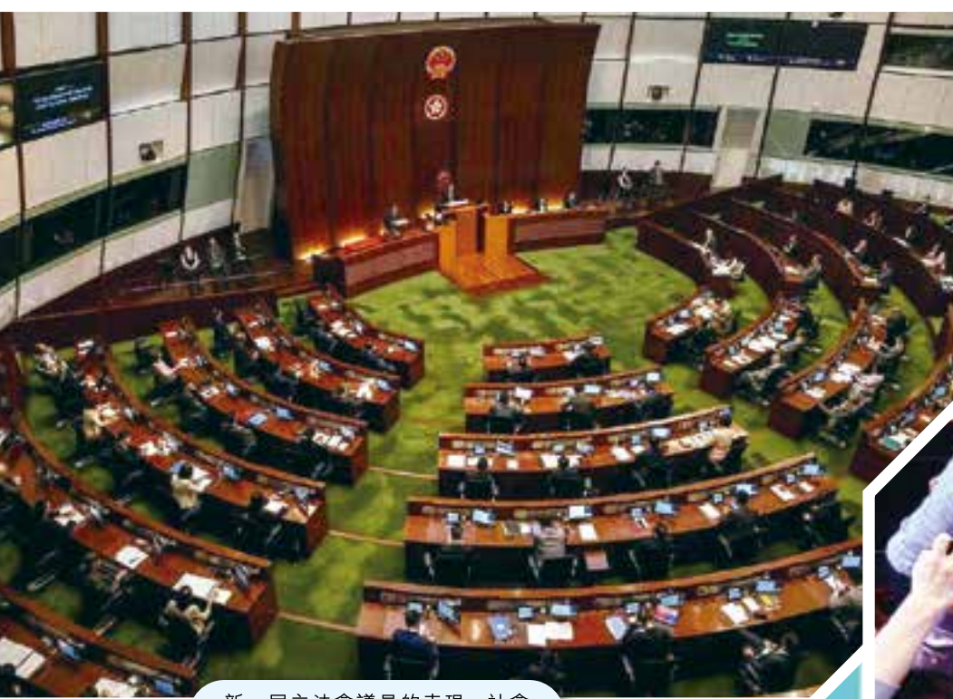
新一屆立法會議員的表現，社會存在褒貶不一的評價。