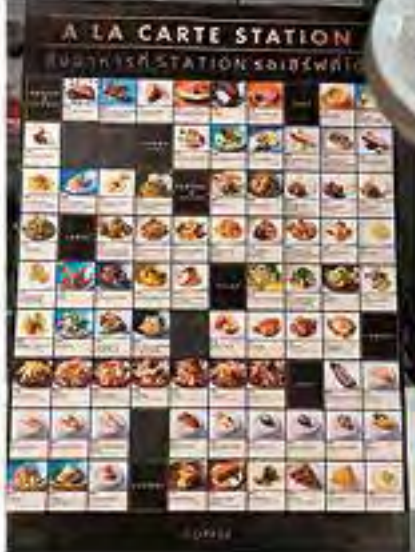
超過 100 款食物任君選擇。