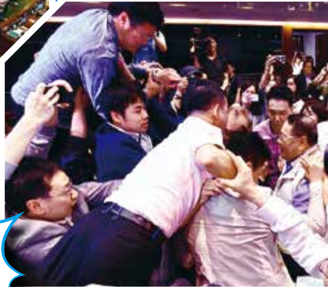
過去的立法會常出現秩序失控，無法正常會議的情況。

的整體表現，尚未能令市民感到滿意。 去年中，有報刊統計指出，2023年1月至8月，立法會通過的24項政府法案中，近9成以不記名方式舉手通過，其中16項表決，實際在席議員未達全體議員50%的門檻。