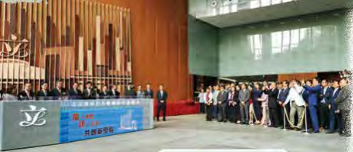
大樓早前進行平頂工程，特首也獲邀出席。