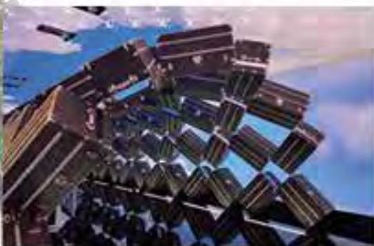
由96個行李箱模塊組裝成的行李隧道「Trunkscape」超吸引眼球。