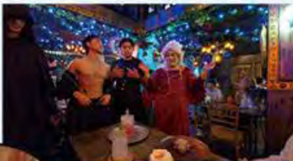
女巫侍應招待閣下。