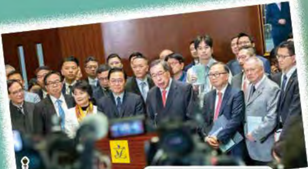
全體立法會議員支持《基本法》23條立法。