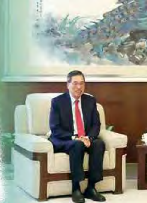
《維護國家安全條例草案》順利通過後，港澳辦主任夏寶龍（右）與梁君彥見面。