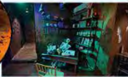
店內走魔幻恐怖風路線，更有骷髏骨做裝飾。