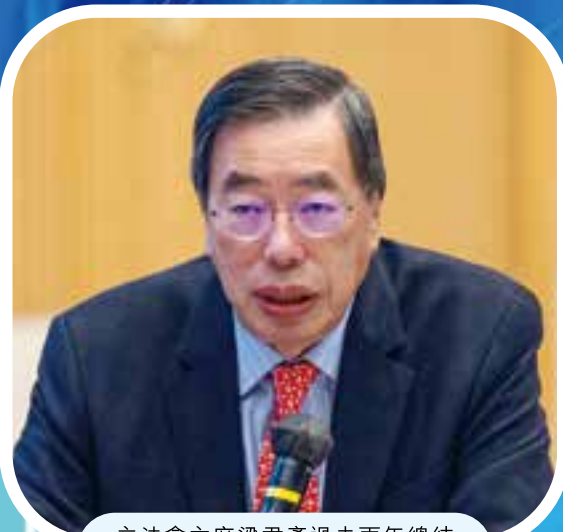
立法會主席梁君彥過去兩年總結立法會工作時，均有正面評價。