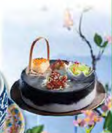
柚香冷麵·荷燻鯧魚·紅菜酥 萵筍伴柚子肉及柚子燒汁炮製成柚香冷麵，另有荷燻鯧魚及紅菜酥，營造溪畔美景。