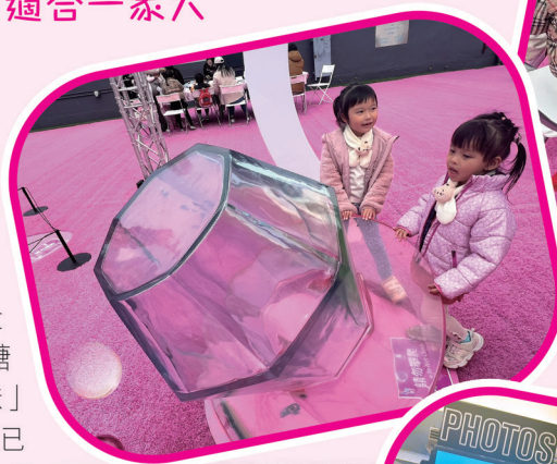
小朋友玩得 不亦樂乎

天台遊玩完後，大家就可以移步到D2 Place一期二樓的「Gummy Gummy 熊熊自拍亭」拍照留念，內裏設有可愛的小熊相框和多種道具供你「扮鬼扮馬」自拍，簡簡單單已經玩得不亦樂乎。自拍完一番之後，大家切記不要錯過D2 Place 二期商場地下的「D2 Delights 甜蜜糖果屋」，在此大家可以參加小熊軟糖夾公仔機挑戰，有機會獲得珍寶版小熊軟糖，而經典「夾糖Bar」更提供多款造型各異的軟糖，全部都是兒時讓人愛不釋手的款式。📍