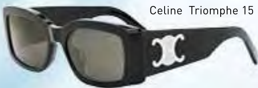
Celine Triomphe 15