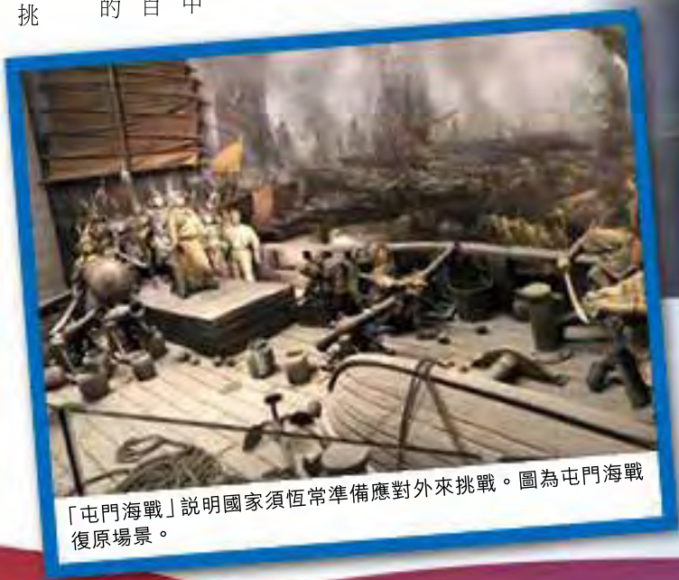
「屯門海戰」說明國家須恆常準備應對外來挑戰。圖為屯門海戰復原場景。