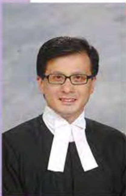
杜浩成曾是常任裁判官及國安法指定法官。

對於指定法官的公正性遭質疑，他強調每名法官都必須宣誓，包括誓言維護法制、主持正義，只會忠於證據以及證據能夠支持的推論，「我們是不會受其他東西影響的，政治也好、文化也好，或者其他個人的考慮，都不會影響，在制度上本身有這個保證」。