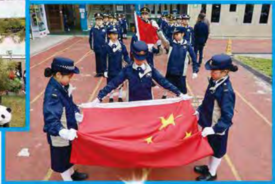
校內亦設有升旗隊，讓小學生建立國民身份認同感。