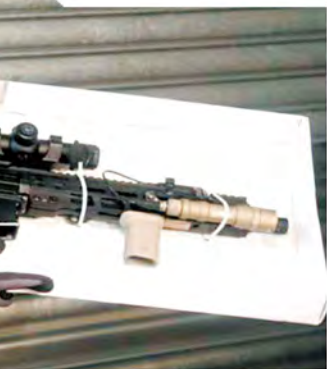
黑暴時期搜出的槍械數量之多，李桂華亦坦言感到震驚。

今年4月15日是國家第10個「全民國家安全教育日」，對於香港警務處國家安全處總警司李桂華來講，具有深刻的意義。