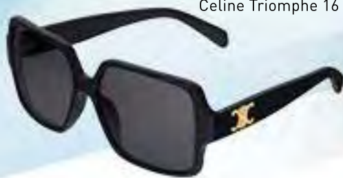
Celine Triomphe 16