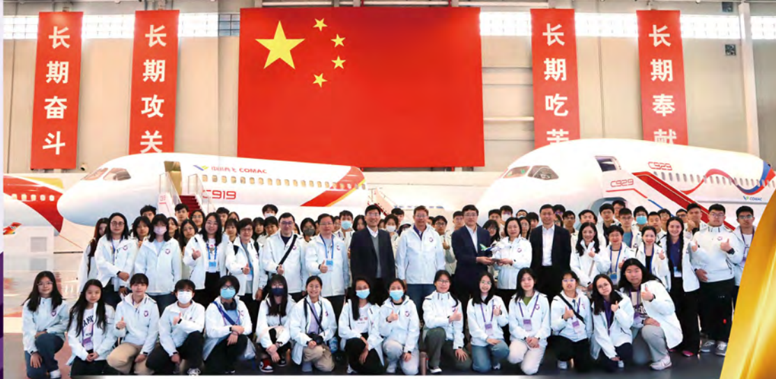
特區政府去年舉辦「國家安全教育參訪團」，帶領多間學校的校長和師生到北京、上海和杭州參訪學習。

至於香港警務處的全民國家安全教育活動，李桂華透露，警察工藝會在今年3月已舉辦了一個以生態