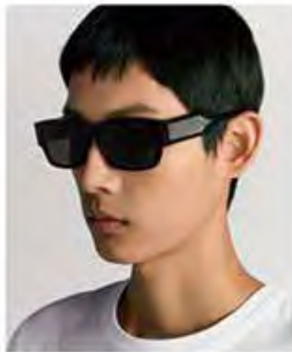
Christian Dior初夏推出Label S1F太陽眼鏡。