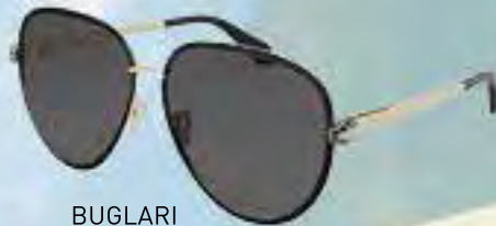
BUGLARI Serpenti Forever