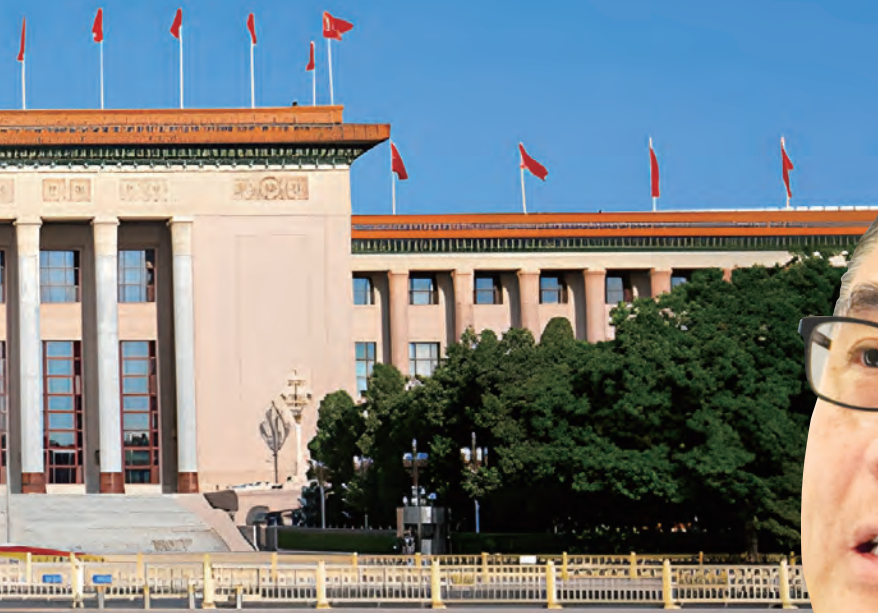
香港警務處國家安全處總警司 李桂華