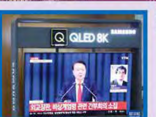
右圖為時任南韓總統尹錫悅去年底宣布緊急戒

全國人民代表大會常務委員會於2015年將每年4月15日定為「全民國家安全教育日」，以總體國家安全觀為指導，深入開展國家安全教育。