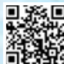
精彩影片 請掃QR code

由香港社建協會及香港河源社團總會主辦摺星星大行動，活動聚集1000名參與者共同摺星星，象徵中國國旗上的五顆星，並傳遞對祖國的祝福，寓意中國閃閃生輝，並增強社區的凝聚力和愛國情懷。活動4月15日下午3時在理工大學邵逸夫體育館舉行。