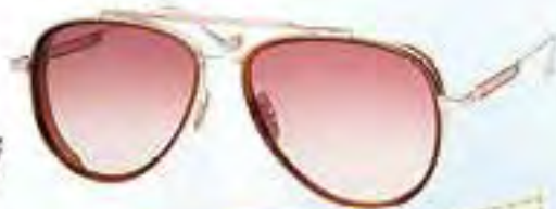
QUE.M E 802403