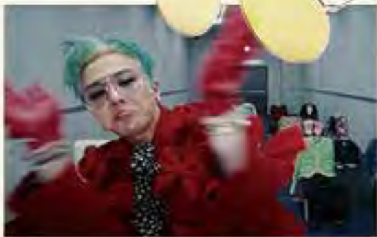
Thom Browne「TBS-015」飛行員眼鏡一向都是G-Dragon至愛，早前在在MaMa 韓國音樂頒獎典禮上就已配戴過。

其中以薄荷綠髮色搭配波點長袍外套的造型，配戴了來自洛杉磯的Jacques Marie Mage (JMM)「Zephirin」，「Zephirin」以10mm板料作材質，加上獨特切割線條，手工頂流。另外，G-Dragon在MV中亦有戴他喜愛的Thom Browne「TBS-015」飛行員眼鏡，金框配紅色頂槓，更特別選用上灰藍色鏡片，大玩型格色系搭配。