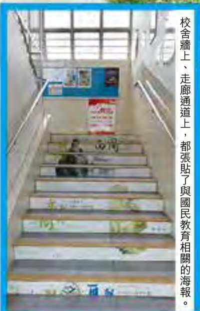
校舍牆上、走廊通道上，都張貼了與國民教育相關的海報。

「怎樣推展國家安全教育呢？我們是從基本做起，從每班的班規開始遵守，然後到校規和家規，到遵守香港法律，一步步推進。」依記者在訪問當日對該校的觀