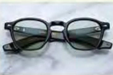
來自洛杉磯的Jacques Marie Mage (JMM)「Zephirin」，造型獨特。