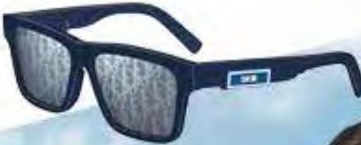
DiorB23 S4F 正方形太陽眼鏡以同名運動鞋為靈感。